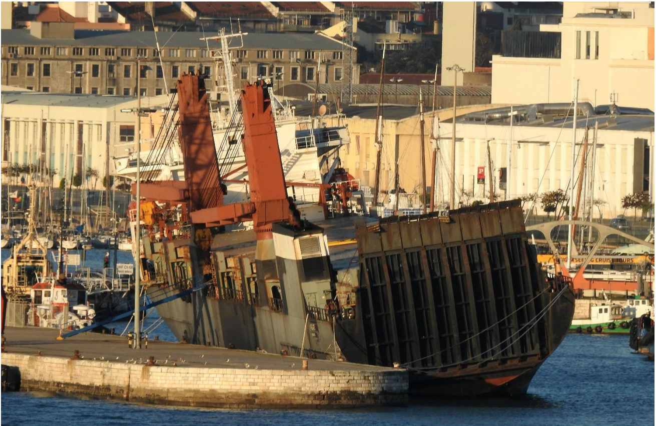
Fotografías: Atracado en un muelle del puerto de Lisboa la mañana del 31 de Diciembre de 2018