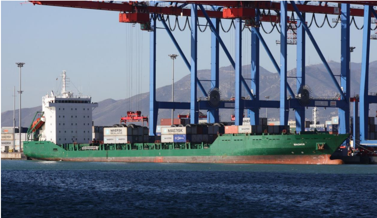
Fotografía: Atracado en el muelle número 9 del puerto de Málaga el 05 de Marzo de 2012